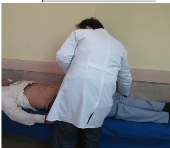
ایستگاه ملنا و معاینه شکم