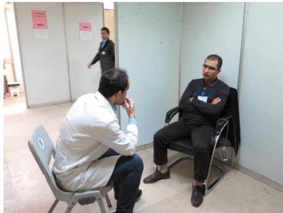
ایستگاه معاینه شکم