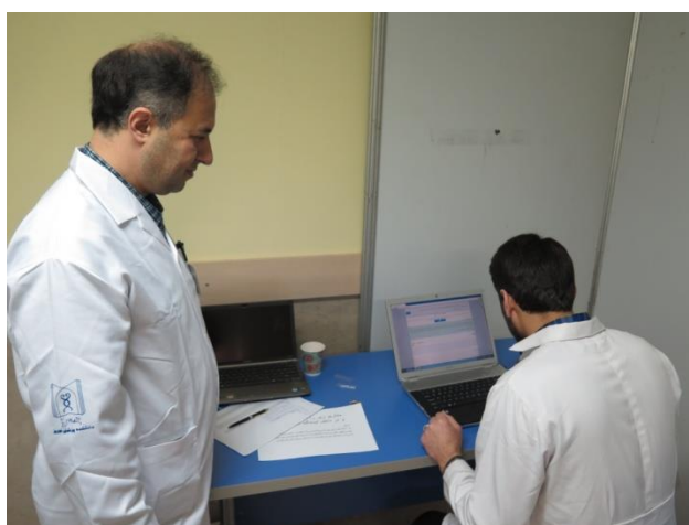
ایستگاه ایکتر (PMP)