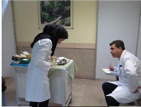
ایستگاه بخیه زدن