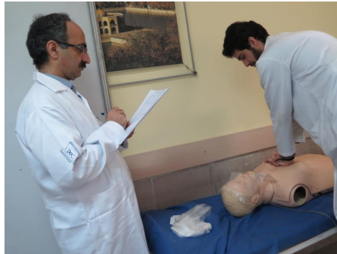
ایستگاه احیای پایه