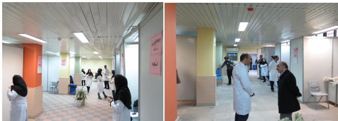
نمایی از سالن آزمون