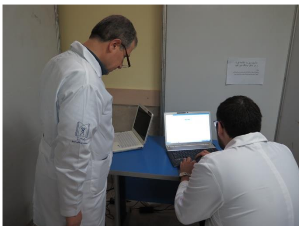
ایستگاه روانپزشکی (PMP)