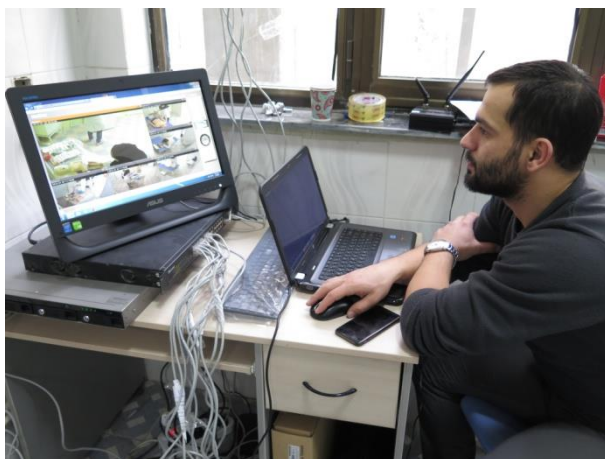
اتاق کنترل ضبط فیلم