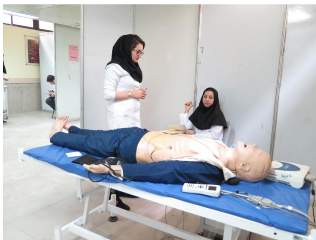
ایستگاه مانیتورینگ قلبی و شوک