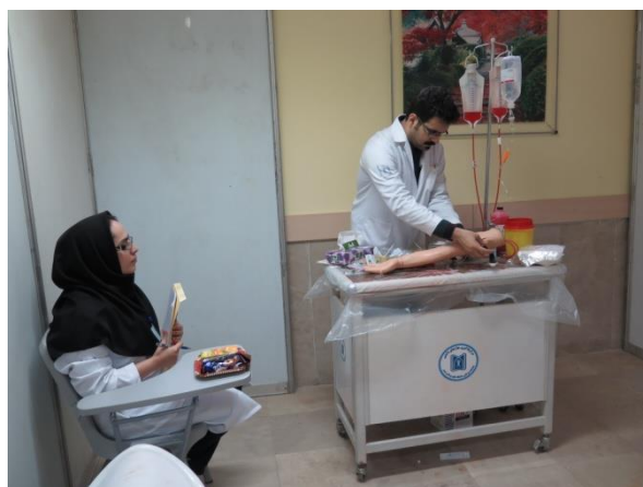
ایستگاه تزریقات وریدی